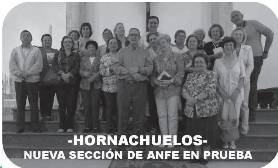
-HORNACHUELOS- NUEVA SECCIÓN DE ANFE EN PRUEBA

El plazo finalizará el día 25 de junio. La plaza se considerará en firme una vez que se haya ingresado 25 € de reserva en la cuenta que ya se os indicará cuando llaméis para apuntaros. Las que estéis interesadas en asistir podéis llamar a la Presidenta Diocesana al 957-23-57-71 .