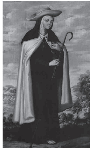
Sta. Teresa de Jesús

Por experiencia he visto, dejando lo que en muchas partes he leído, el gran bien que es para un alma no salir de la obediencia. En esto entiendo estar el irse adelantando en la virtud y el ir cobrando la de la humildad; en esto está la seguridad de la sospecha que los mortales es bien que tengamos mientras se vive en esta vida, de errar el camino del cielo. Aquí se halla la quietud que tan preciada es en las almas que desean contentar a Dios. Porque si de veras se han resignado en esta santa obediencia y rendido el entendimiento a ella, no queriendo tener otro parecer del de su confesor y, si son religiosos, el de su prelado, el demonio cesa de acometer con sus continuas inquietudes, como tiene visto que antes sale con pérdida que con ganancia; y también nuestros bulliciosos movimientos, amigos de hacer su voluntad y aun de sujetar la razón en cosas de nuestro contento, cesan, acordándose que determinadamente pusieron su voluntad en la de Dios, tomando por medio sujetarse a quien en su lugar toman. Habiéndome Su Majestad, por su bondad, dado luz de conocer el gran tesoro que está encerrado en esta preciosa virtud, he procurado -aunque flaca e imperfectamente- tenerla; aunque muchas veces repugna la poca virtud que veo en mí, porque para algunas cosas que me mandan entiendo que no llega. La divina Majestad provea lo que falta para esta obra presente.