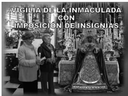
VIGILIA DE LA INMACULADA CON IMPOSICIÓN DE INSIGNIAS