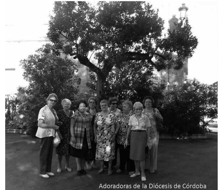
Adoradoras de la Diócesis de Córdoba

1 de los Estatutos). Esta Asociación, ANFE, tiene tres niveles: Nacional, Diocesano y Local. En todos los niveles el órgano supremo es la Asamblea; cada nivel tiene su Consejo con Presidenta, Secretaria, etc. que es el órgano ejecutivo, y cada Consejo tiene su Comisión Permanente con la finalidad de velar por la buena marcha de la Asociación. En cada uno de estos niveles hay un Consiliario o Director que ostenta la representación de la Jerarquía Eclesiástica. La Presidenta encarna la representación y autoridad de la Obra (Artº 13). El Turno es la célula viva de la Asociación, la