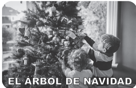
EL ÁRBOL DE NAVIDAD

En la Edad Media, esta costumbre se expandió en todo el viejo mundo y, luego de la conquista, llegó a América.