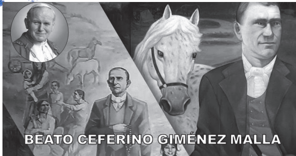
BEATO CEFERINO GIMÉNEZ MALLA

Un día apareció en la fachada del Vaticano el cuadro de un santo del todo excepcional. Nunca se había visto uno semejante. Y el papá lo declaraba Beato, digno de los altares y presentado a la veneración de los fieles como ejemplo de vida cristiana.